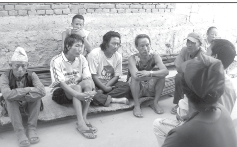
सिंदुलिडा कोइँचपुकि आम रुमदेलवुमदेलमि लोसि पानाना ।

मेकोन गेकालि ०६५ थोचेडा आसार ३१ नु ३२ नावु राजजे पुनासाइराचानामि कोइँच खापकालि दोपा राइचा देँशो विचार गोअथि पाशा कोइँचआन थुँडा लो खुपशोनु नेललि कोइँचमि कोइँच रुमदेलवुमदेल (सुनुवार सेवा सामाज) नि जेमनावासि ओमोलतौवल रागि (जातिये सोयेतता राजजे) ताअचकालि डोइति वारचा मालवा देँशो नेनेपसि थाइशि पाशो नामनाति । मेकेला मेकोन कोइँचआन लोःकालि कुरग्यो शाअ खिअशा ०६५ काततिके ३० नावु ल्लोपशा सुइ सुइनु ग्याइशिरले ला पा गाअचकालि मेकोन थोचे पुस १५ गाते होबनाकेसिआन फेचे गिपशिदुडा पंजेरकोच नु सुनुवार सेवा सामाजआन दाःथेमि कोइँच सोयेतता रागिआ पितिमि लोःखिकखोलशो नामनाति । एको नेललि ग्लुमसिचेमसि नु लोःखिकखालिसकालि खोंदेशि थेशशा कोइँच रुमदेलवुमदेलमि आइतिहासिक ताथा पारामपारिक खाप, जेमनावासि, लोःसिसि, थेमराअसिआ लांगारमि ओललो किरात सोयेतता राजजेके आवादाराना २०६५ थोचे