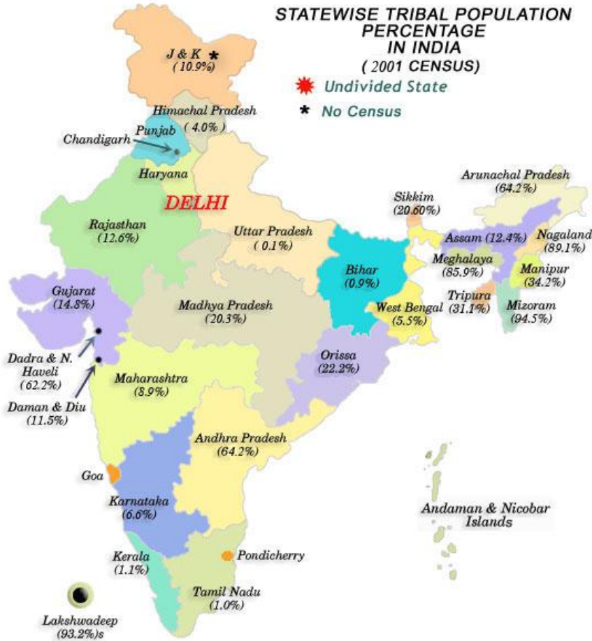
Map 1: State wise Tribal Population percentage in India-2001 (used in Rapacha 2009: 39)